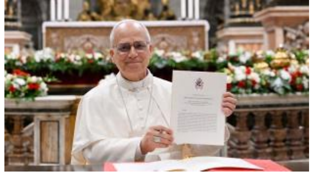
El Papa León XIV muestra la carta apostólica «Diseñar nuevos mapas de esperanza» tras su firma el 27 de octubre de 2025 en la Basílica San Pedro.

“La escuela católica es un entorno en el que se entrelazan la fe, la cultura y la vida. No es simplemente una institución, sino un entorno vivo en el que la visión cristiana impregna todas las disciplinas y todas las interacciones. Los educadores están llamados a asumir una responsabilidad que va más allá del contrato de trabajo: su testimonio vale tanto como sus lecciones.”