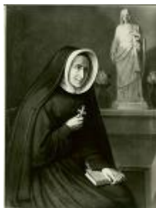
Sta. M. Sofia