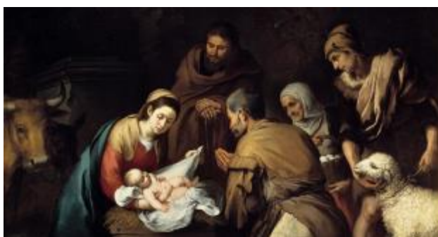
Adoración de los pastores—Murillo—Museo del Prado