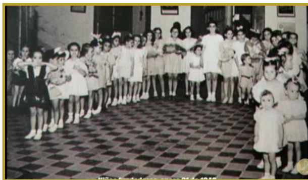
Primeras alumnas enero 21, 1946