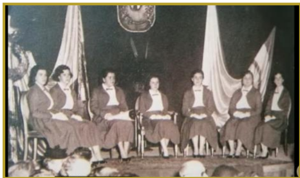
Primera Promoción 1952