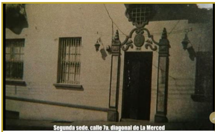
Segunda sede, calle 7a. Diagonal de la Merced