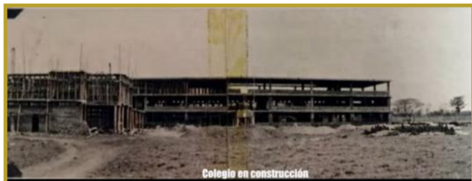
Colegio en Construcción