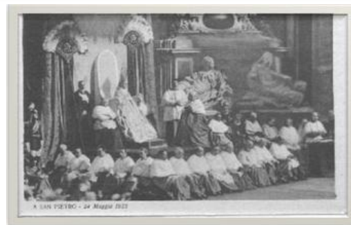
Ceremonia de Canonización