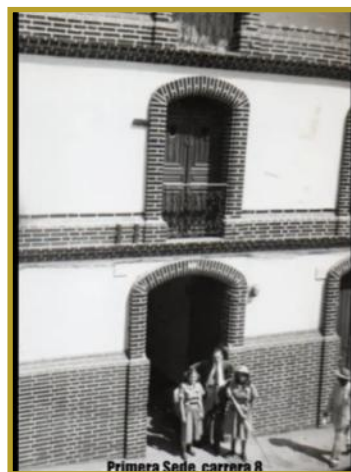
Primera sede Carrera 8